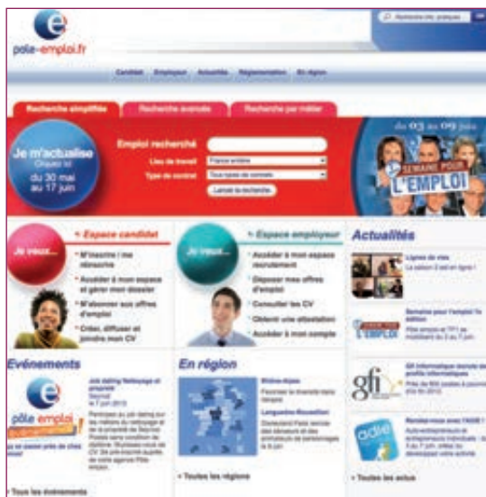
Page d'accueil du site www.pole-emploi.fr

Quelques exemples de CV-thèques : cv.enligne-fr.com , cv.com , cv-theque.fr .